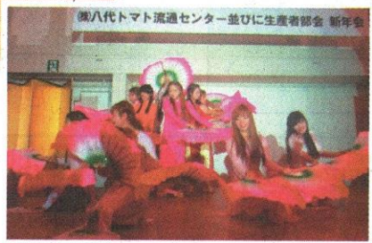
▲新年会では海外からの研修生によるダンスの発表も。仕事を学び、文化交流し、健康づくりにも励むことができる同社で、充実した日々をおくっています