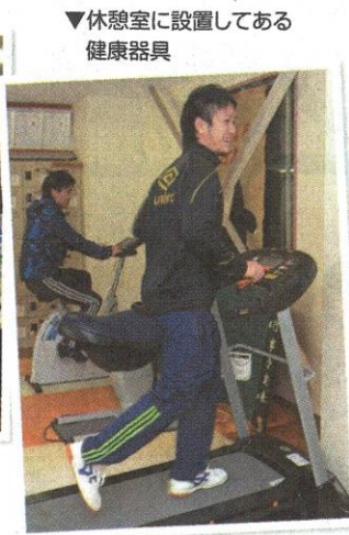
▼休憩室に設置してある健康器具